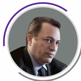
Ευριπίδης Στυλιανίδης Βουλευτής / Επίκουρος Καθηγητής Νομικής στο Ευρωπαϊκό Πανεπιστήμιο Κύπρου