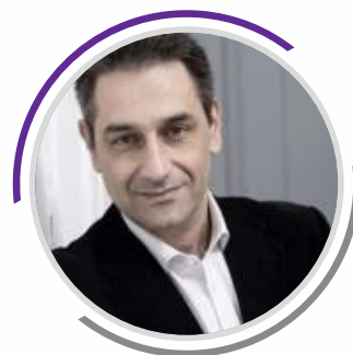
Γρηγόρης Ζαρωτιάδης Αναπληρωτής Καθηγητής, Κοσμητόρας Σχολής Οικονομικών & Πολιτικών Επιστημών