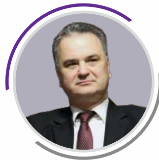
Σωκράτης Ξυνίδης Δικηγόρος / πρώην Υπουργός